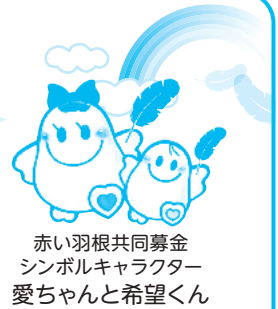
赤い羽根共同募金 シンボルキャラクター 愛ちゃんと希望くん

交野地区募金会では、今年も「赤い羽根・歳末たすけあい募金助成金事業」として、地域組織やボランティア団体などが交野市内で展開する地域福祉活動に対して助成します。なお、助成金の原資は令和5年度「赤い羽根共同募金」「歳末たすけあい募金」でいただく募金であり、大阪府共同募金会からの配分を受けた額の範囲となります。