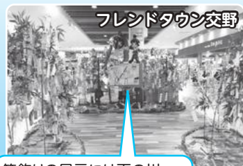
フレンドタウン交野