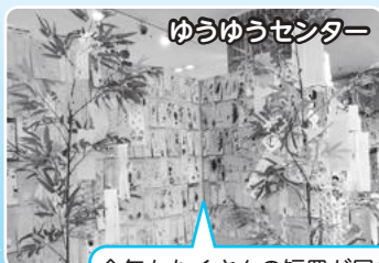
ゆうゆうセンター