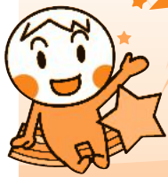
マスクットキャラクター にじ丸ちゃん

[編集と発行] 社会福祉法人 交野市社会福祉協議会 〒576-0034 交野市天野が原町5-5-1 ☎ 072-895-1185 FAX 072-895-1192 ✉ nijimaru@katano-shakyo.com ホームページ https://katano-shakyo.com/