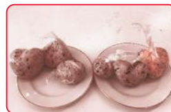
おにぎりを作ったよ～