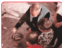
火おこして難しいなあ