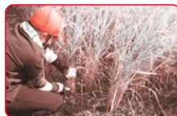
しっかり握って稲刈り