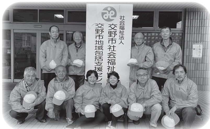
60代～70代の男性が多いですが、女性も活躍されています！