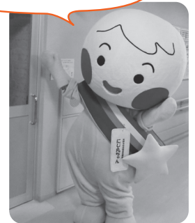
初代 にじ丸ちゃん