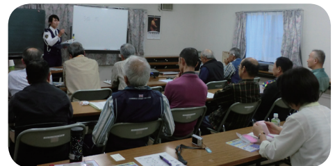
(写真上) 安全運転者講習を受講

移送サービスは、ボランティアさんの協力で成り立っている事業です。ひとりでも多くの人に利用していただけるよう、今後もさらなる充実を目指していきます。