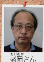
もりおか 盛岡さん