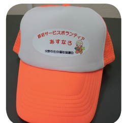
(写真右) 新しい帽子ができました。