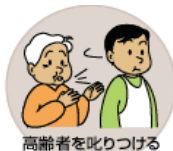
高齢者を叱りつける・無視する 心理的虐待