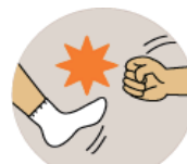
殴る蹴るなどの暴力 身体的虐待