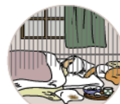
劣悪な環境で放置 放棄・放任