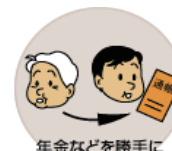
年金などを勝手に使ってしまう 経済的虐待