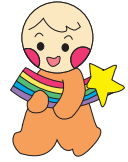
交野市社協マスコットキャラクター にじ丸ちゃん 人と人のつながりを 大切にする“かけはし”に