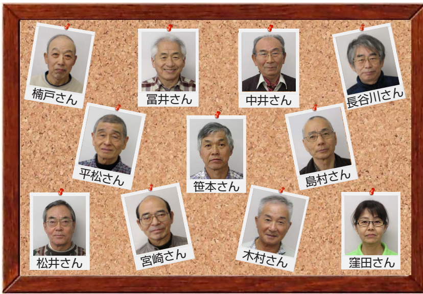
運転ボランティアのみなさん

社会福祉協議会では、第 2 期交野市地域福祉活動計画に基づき、24 年 3 月 27 日から移送サービス事業を展開しています。この事業の推進力となっているのは、運転ボランティアのみなさんのご理解・ご協力によるものです。今回はボランティアアさんの声と利用者さんの声を一部紹介させていただきます。