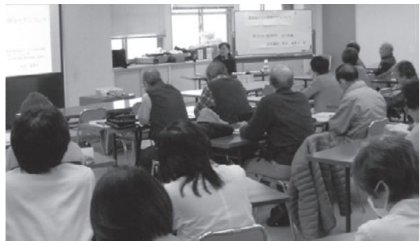
熱心に聞き入るみなさん