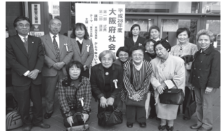
ボランティアで表彰されたみなさん・街頭募金で感謝状を贈られたボランティアグループ連絡会のみなさん