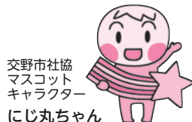
交野市社協 マスコット キャラクター にじ丸ちゃん