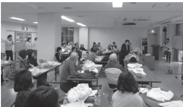
実技も盛り沢山でした