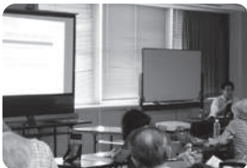
交野市地域社会部から