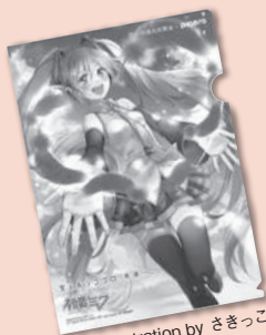
illustration by さきっこ