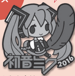
illustration by シノコ