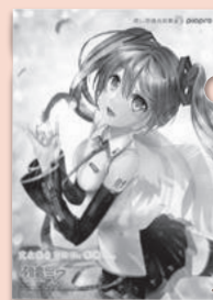
illustration by 白羊 ゆき