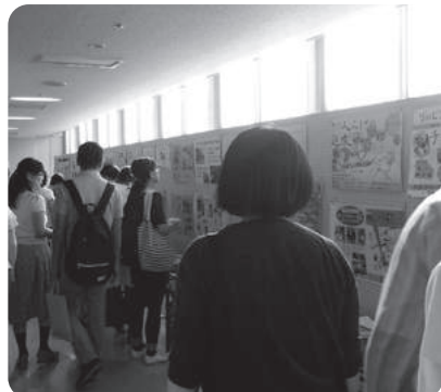
パネル展示に見入る人たち

当日は多くの方にご来場いただき、ありがとうございます。今後も、市民の皆様からいただきましたご意見を参考に、「参加して良かった」と思っていただけのような市民フォーラムを企画、開催させていただきます。と思っています。