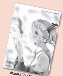
illustration by かぎの

© Crypton Future Media, INC. www.piapro.net