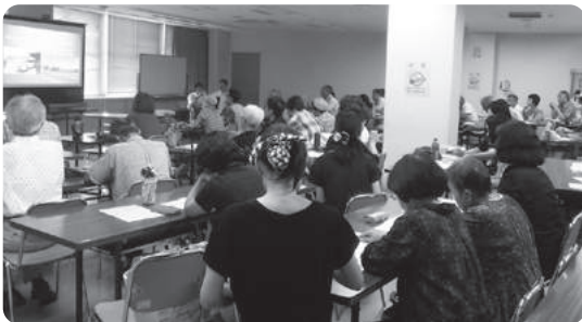
交野市消防本部からの報告