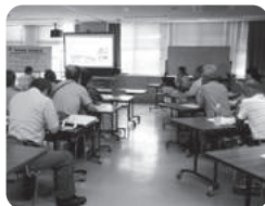
社会福祉協議会から