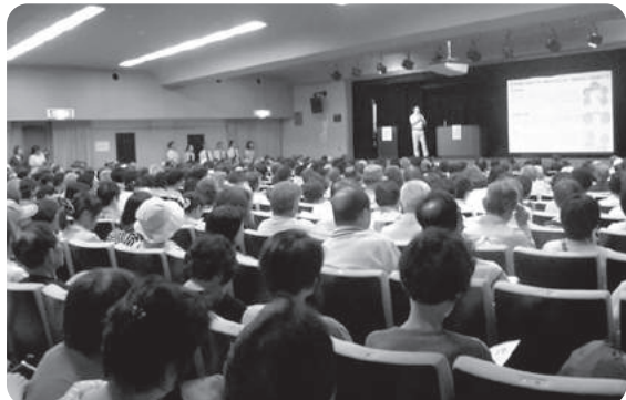
満員の市民フォーラム会場

また、今回は初の試みとして、交野市内の介護保険サービス事業所等に事業所のPRパネルを作成していただき、ご紹介させていただきました。