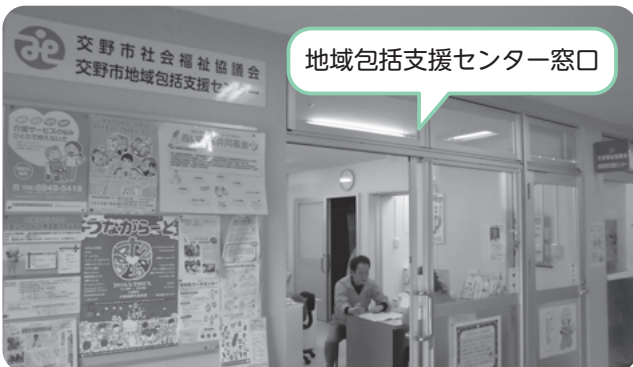
地域包括支援センター窓口

みなさんはじめまして。今年の4月に入職しました。早く地域のみなさんを知り、お力になれるよう一生懸命がんばりますので、これからどうぞよろしくお願いいたします。