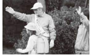
軽費老人ホーム入居者による見守り活動