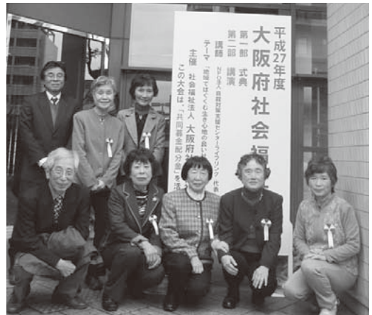
ボランティアで知事表彰されたみなさん