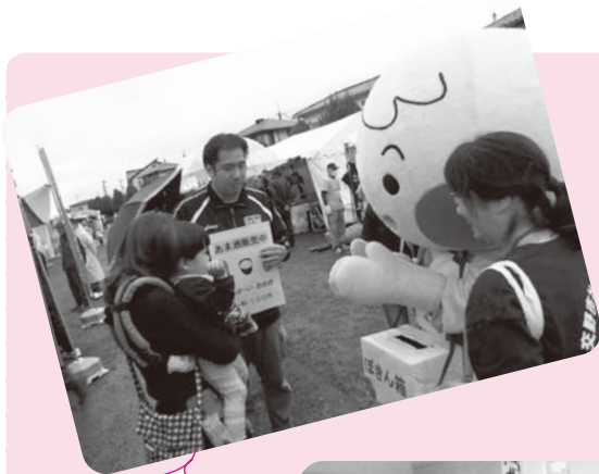
にじ丸ちゃんも募金活動に参加しました

大阪府共同募金会へ送金したのち、次年度(平成28年度)に交野市社会福祉協議会へ配分され、地域福祉活動事業で活用いたします。