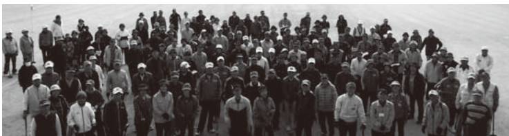
交野市グラウンドゴルフ協会のみなさん