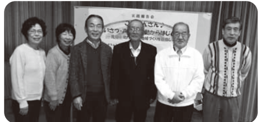
報告にご協力いただいた地域のみなさん