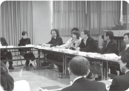
策定・推進委員会