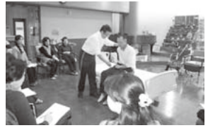
市民向けの介護技術講座

豊年福祉会は昭和55年に設立し、高齢者介護事業、障がい者福祉事業（施設・居宅サービス）を行っています。地域に向けての取り組みとして、コミュニティホールを持ち、地域の方々の憩いの場として開放し、年間延べ2千人の方にご利用いただいています。生活にお困りの方への生活困窮レスキュー事業、法人が持つ機能（場所、介護技術&知識、マンパワー、機器）を使っっての市民向け「介護技術講座」「市民セミナー」等の開催、地区催し（夏祭りや防災訓練）への出店と協働、軽費老人ホーム入居者による見守り活動など、開設当初より地域に開かれた法人でありたいと歩み続けてきた35年です。