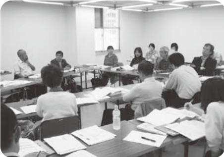
虹色ネットワーク会議