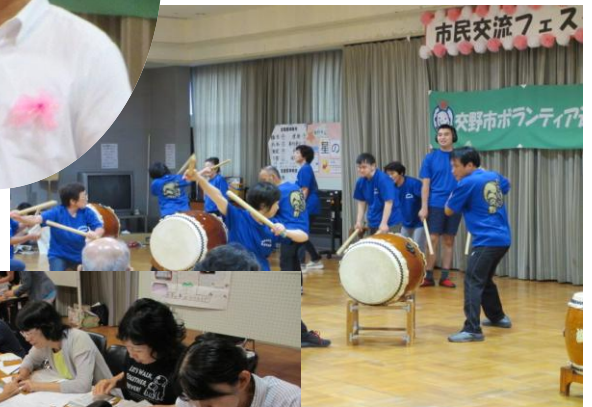
ででんこ交野の和太鼓演奏