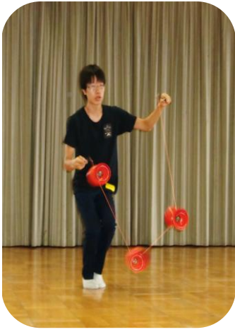
ジャグリングの演技

8月22日(土)、「障がい児(者)親の会」によるサマースクールがゆうゆうセンターで開催され、ボランティアグループ「ふれんズ」がイベントのお手伝いをしました。今年も交野高校生の協力があり、ジャグリング部の演技と美術部の段ボール作品の展示。手づくりトーマスランドの製作では、(株)矢野紙器さんの指導の下、障がい児と高校生が一緒になって段ボール電車を作り、みんなで楽しみました。