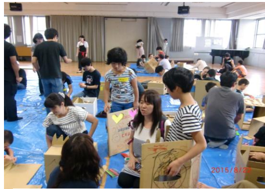
～段ボール電車を製作中～