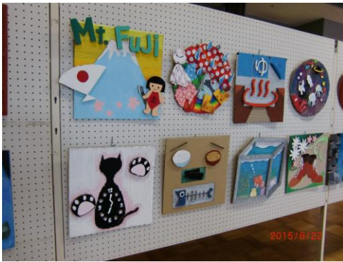
段ボールアート作品の展示