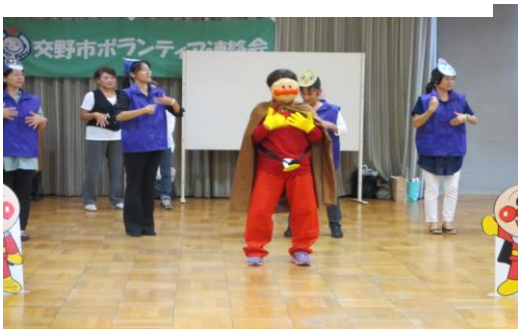
アンパンマン登場(手話コーラス)