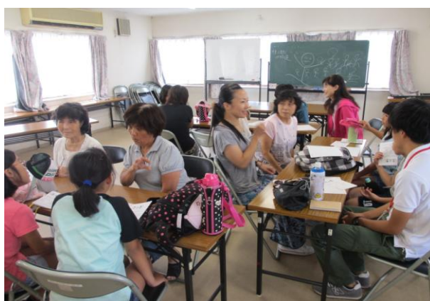
Vセンターで手話体験をする子どもたち

2日目は「ハートフルステーションいわふね」での作業お手伝いの後は、ボランティアセンターで手話「さつき」による手話体験など、元氣いっぱいの子供たちです。