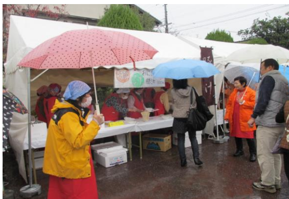
昨年は雨の中での開催でした

また植木・草花のご提供も合わせてお願いします。尚、バザー用品のご提供は10月中旬から、植木・草花は11月からボランティアセンターで受付けを始めます。