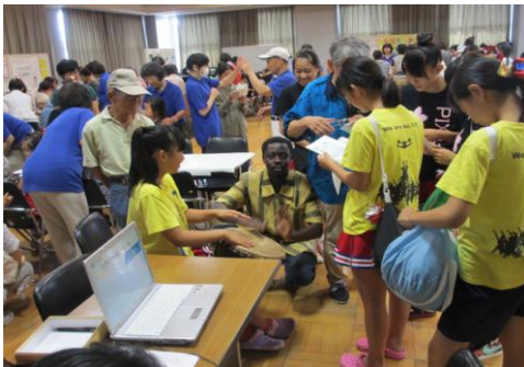
ケニアの青年を囲んで