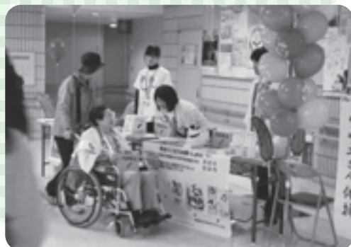
平成26年「健康福祉フェスティバル」の会場でもボランティアさんと共同募金を呼びかけました

平成26年10月1日からスタートした「赤い羽根共同募金」と同年12月1日からその一環で実施した「歳末たすけあい募金」にご協力いただき、ありがとうございました。 なお、歳末たすけあい募金にご協力いただいた事業所名等を4ページに掲載しています。