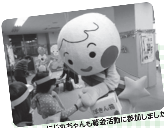
にじ丸ちゃんも募金活動に参加しました

大阪府共同募金会へ送金したのち、次年度（平成27年度）に交野市社会福祉協議会へ配分され、地域福祉活動事業で活用いたします。