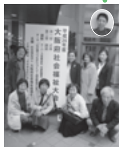
ボランティアの皆さま