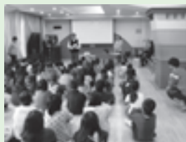
私市小学校(5年生) 11月12日(水) 「大好きだよキョちゃん」(作者:藤川幸之助)の絵本読み聞かせにより学びました

☀️ でかけるときはオレンジリングをつけて、いろんな人にやさしくできる人になりたいです。