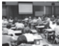
昨年の 人権研修会 の様子です