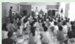
岩船小学校(5年生) 7月16日(水) 「サザエさん一家」の寸劇にくぎづけです

交野市ではじめて小学校で、「認知症サポーター養成講座」を開催しました。 キャラバン・メイトの協力を得て楽しく学び、小学生141人の認知症サポーターが誕生しました。 認知症サポーター養成講座開催は随時受付中です。申し込みは社会福祉協議会まで。