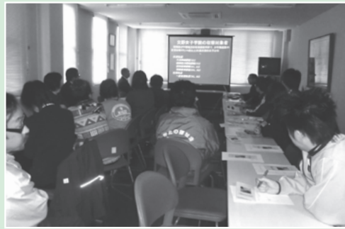
交野女子学院に視察 (平成25年11月研修会)

地域住民にとって身近な施設であるために、地域に貢献できる事を連絡会として取り組んでいきます。今後も施設紹介や取り組み内容等を順次掲載していく予定です。