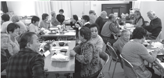
●藤が尾小学校区福祉委員会