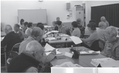
●郡津小学校区福祉委員会 (松塚地区)

今後、校区福祉委員会では、誰もが安心して暮らせるまちづくりを目指して取り組みを進めていきます。