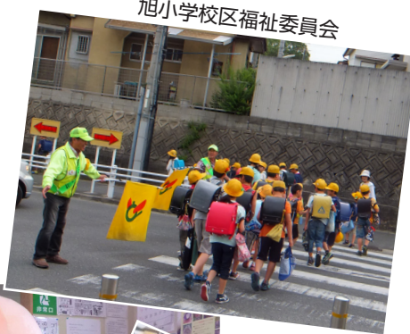
旭小学校区福祉委員会