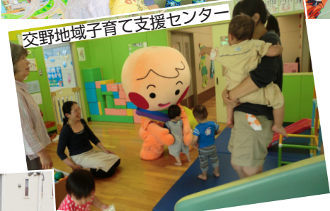
交野地域子育て支援センター

校区福祉委員会では、安心・安全な地域づくりを目指し、ふ だんからごきげんさん運動に取り組んでいます。小学校の登下 校時だけでなく、駅前や通学路など各地で展開されており、地 域に根差した活動を目指しています。 6月3日(月)から6月7日(金)までの5日間実施された キャンペーンには、「にじ丸ちゃん」も参加しました。 今後も、校区福祉委員会と「にじ丸ちゃん」はごきげんさん 運動を継続します。