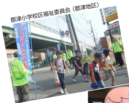
郡津小学校区福祉委員会 (郡津地区)

第 118 号 編集と発行 社会福祉法人 交野市社会福祉協議会 〒 576-0034 交野市天野が原町 5-5-1 電話 072-895-1185 F A X 072-895-1192 E-mail nijimaru@katano-shakyo.com ホームページ http://katano-shakyo.com/